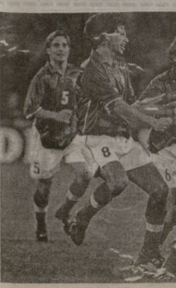
იბალია-შვიტინარი 2-0. დელ პიეროს (N10) გუნდის ერთ-ერთი მატჩი.