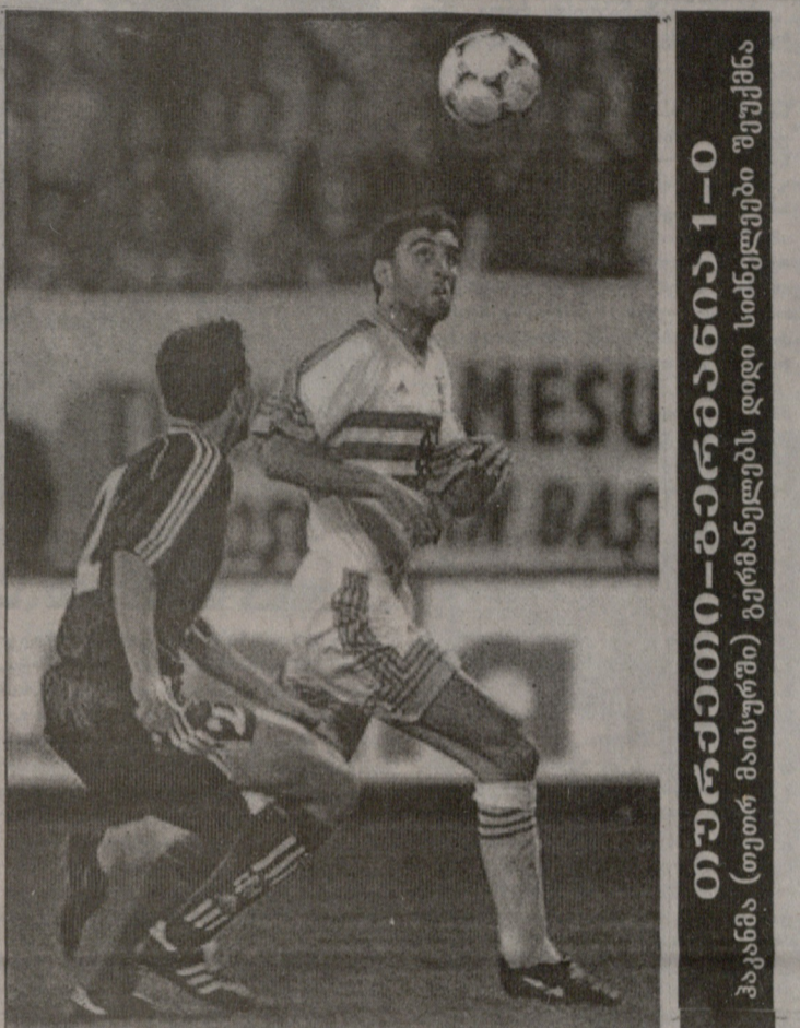
თურქეთი-გერმანია 1-0 პაკანი (თეთრ მისურში) გერმანელებს დიდი სიბნელები შეუქმნა