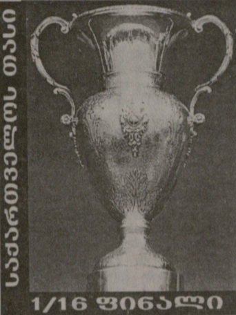
საპარტნიორო ფონდის თასი 1/16 ფინალი

დღეს, 13 ოქტომბერს დიდუბის რაიონის სასამართლოში დასრულდება საფეხბურთო კლუბთბილისის „დინამოს“ მიერ საპარტნიორო ფონდიდან 28 მილიონი ლარის არამისხობრივად დახარჯვის საქმის განხილვა და მოსამართლე მიხეილ კოტრიკაძე გამოიტანს განაჩენს. ბოლოს და ბოლოს გაიტყვევა მართლაც იყო დანაშაულებრივი ქმედება თუ ყოველივე შეთითხნილია სფფ-ს საარჩევნო მართონიდან მერაბ ჟორდანიას ჩამოცილების მიზნით?