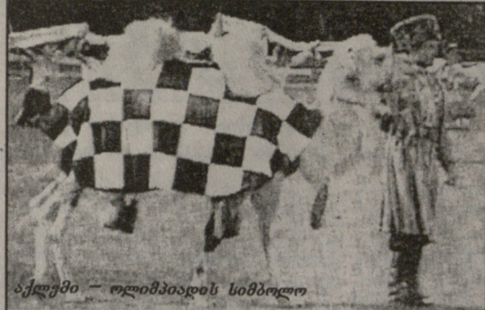
ბელონი - ოლიმპიადის სიმბოლო