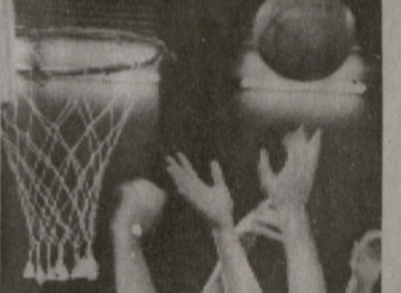
საქართველოს სპორტის სახელმწიფო დეპარტამენტი და კალათბურთის ეროვნული ფედერაცია დაბადებულან 60 წლისთავს ულოცავენ ამავ ფედერაციის საპატიო პრეზიდენტს ალექსანდრე ჩხვიციანი.