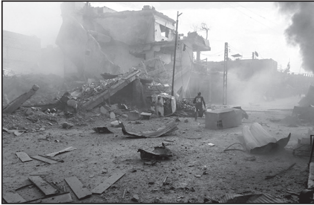
დაახლოვებული ებრაელები და არაბები. მან არ გამოორიცხა, რომ ებრაელებსა და პალესტინელებს შორის ამ გზით შესაძლებელი გახდება მჭიდრობის მიღწევა.

ისრაელის პრემიერის თქმით, ირანის აგრესიას პოზიტიური ფაქტორიც ახლავს. ამაზ