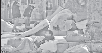
თარში გადაიგზავნება თავშესაფარში. მათგან სამი ათასს არ გააჩნია არანაირი თავშესაფარი, მათ შორის, არც დროებითი.

აღსანიშნავია, რომ გასულ წელს 500-მდე უსახლკარო ადამიანი გარ- დაიცვალა. 2018 წელს, მხოლოდ პარიზ- ში, უკვე 13.