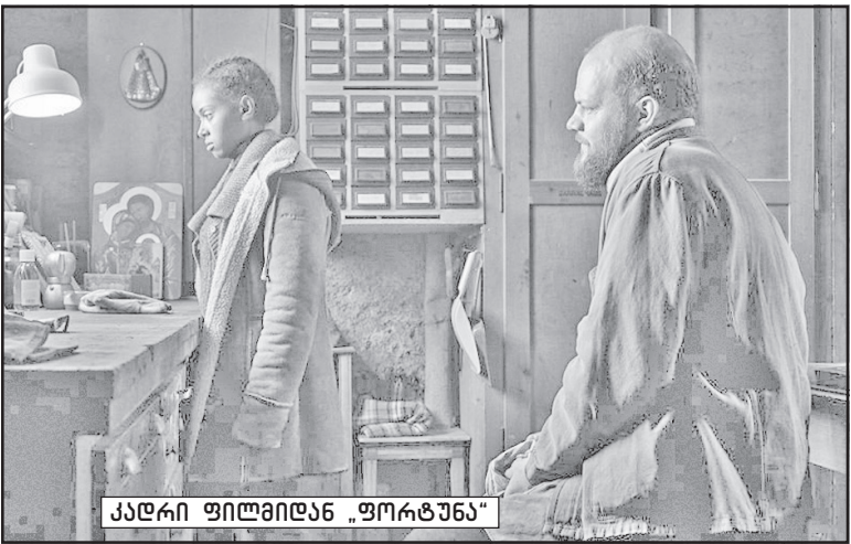
კადრი ფილმიდან „მორტუნი“

ყურებელი სტუმრობს ყოველ- წლიურად ბერლინალეს ამ სექ- ციას და, რა თქმა უნდა, დიდია მისი როლი მოზარდი თაობის ჩამოყალიბებაში, მის ესტეტი- კურ აღზრდაში... ეს ფილმები