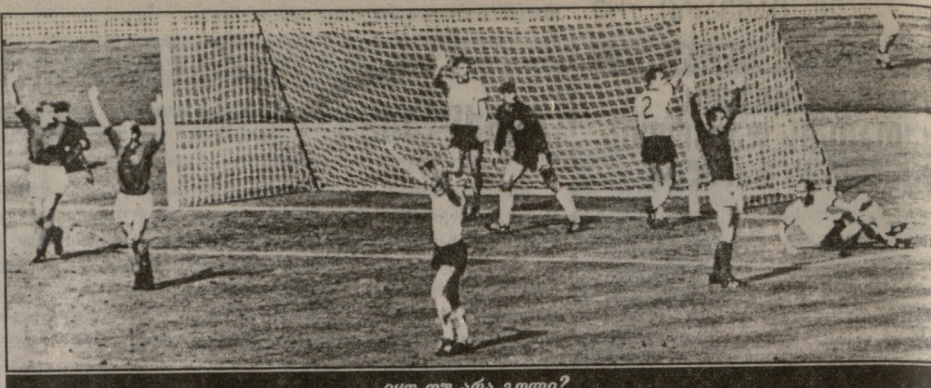
იყო თუ არა გოლი?