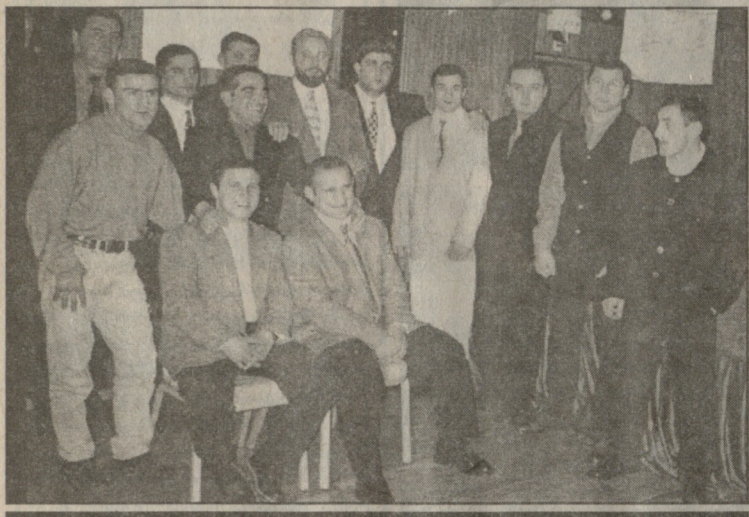
სამახსოვრო სურათი რეკულებთან