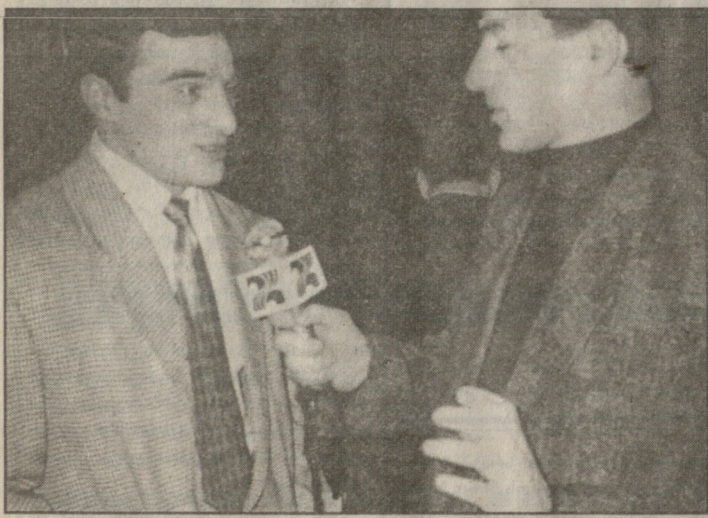
„რუსთავი-2“ ყველგან საქმე შია...