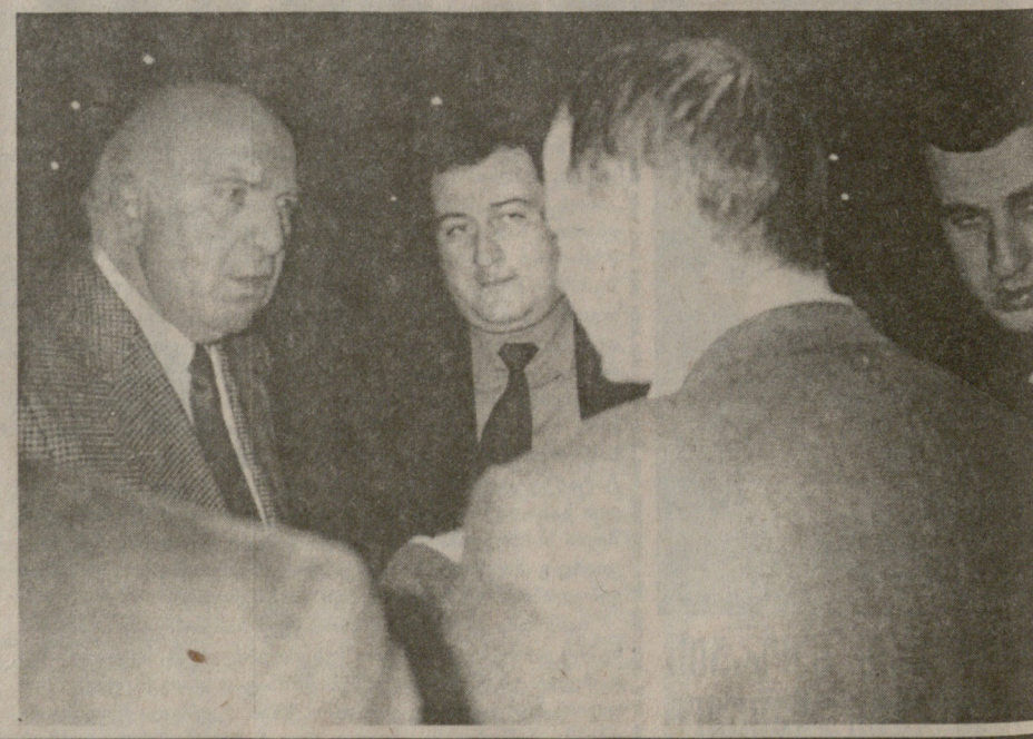
მხიარული და საჭიანი საუბრები