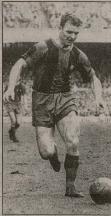
კუბალა (1958/59 წ.წ. სეზონი)