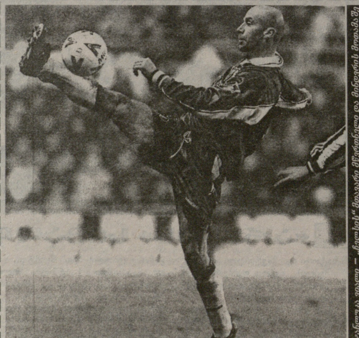
ჯანსუკი ვიალი — „ჩელსის“ მთავარი მწვრთნელი და მინდვრის მოთამაშე

ხება თავდასხმის სუპერტანდებს ვიერისა და სალასს, იგი, ეტყობა, ერთ-ერთი უძლიერესია მსოფლიოში. ინგლისის ჩემპიონატის ერთ-ერთი ლიდერი, ლონდონის „ჩელსი“ ტურნირის მეორე ფაქტორებად უნდა ჩაითვალოს. მეტად ძლიერი შემადგენლობა ჰყავს, სადაც შეიძლება ყინის (!) ნაკრებების მოთამაშეები შედიან. მათ შორის მსოფლიო ჩე-