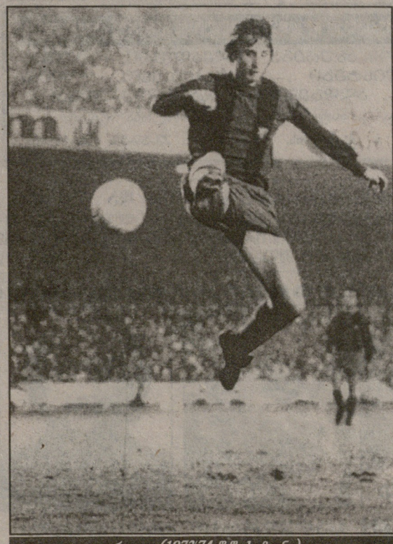
კრუფი (1973/74 წ.წ. სეზონი)

„ბარსელონა“ დაფუძნდა 1899 წლის 22 ოქტომბერს, როცა ბარსელონაში მცხოვრებმა შეედმა ბიზნესმენმა ჰანს გამპერმა განცხადება გამოაქვეყნებინა ჟურნალ „Los Deportes“-ში. აი ის ტექსტიც: „ჩვენს მეგობარსა და კოლეგას, ჩვენი გაზეთის ფეხბურთის განყოფილების წევრს, შევდეთის ყოფილ ჩემპიონ ჰანს გამპერს სურს მოაწყოს საფეხბურთო მატჩი ბარსელონაში. დაინტერესებულმა ფეხბურთელებმა უნდა მიმართონ მას“. სწორედ ეს განცხადება იყო პირველი ნაბიჯი იმ გზაზე, რითაც „ბარსელონა“ გახდა მსოფლიოს ერთ-ერთი საუკეთესო კლუბი არა მარტო სპორტული თვალსაზრისით, არამედ პოლიტიკური, სოციალური და ბიზნესის ასპექტებითაც. გამპერის შეტყობინებას მყისვე გამოეხმაურნენ ბარსელონაში მცხოვრები ინგლისელი, გერმანელი, შოტლანდიელი და რა