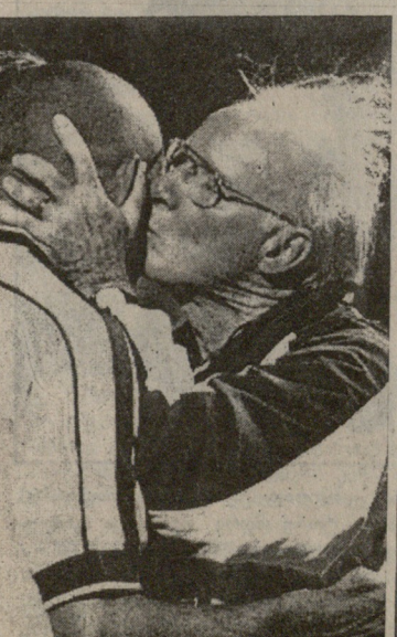
ზაგალოს რონალდოს იმედი კიდევ აქვს

მიზეზი იზოლაციაა, რომელშიც ეს ფეხბურთელი ბრაზილიიდან გამგზავრების შემდეგ იმყოფებოდა. მაშინ იგი თვდაპირველად ჰოლანდიაში თამაშობდა, ელჩინალისტებიც აწუხებდნენ და გულშემატკივრებიც. მისი მდგომარეობა გაუმჯობესდა ესპანეთში, სადაც რონალდოს შეეძლო პორტუგალიაშიც ელაპარაკა და ესპანურადც. ამასთან, იგი ყველგან და ყველგან უნდა ყურადღების ცენტრში იყო, ეს კი ძალზე ძნელია ახალგაზრდა კაცისათვის, რომელიც თანაგრძობასა და მზრუნველობას სჭიროებს. ყოველივე ამის მიუხედავად, ზაგალო იმედი აქვს, რომ რონალდო