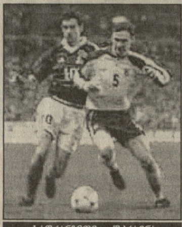
საფრანგეთი - შვედეთი