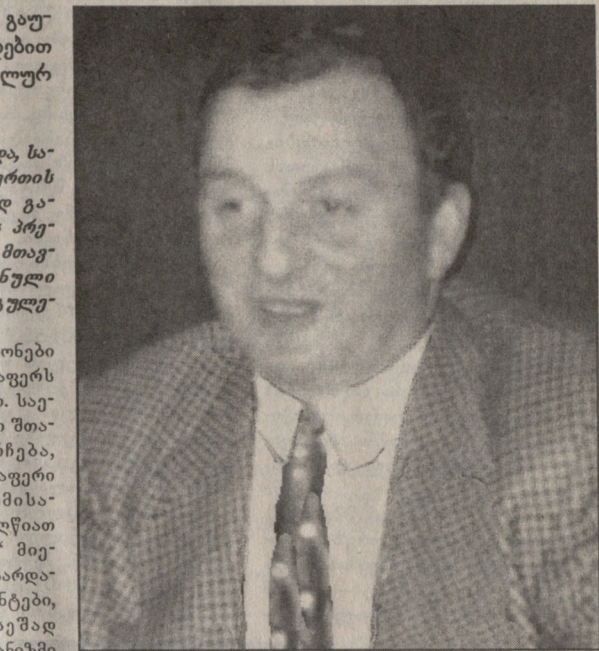
ბანკში სფფ-ს ანგარიშს, რამაც უმბო მესი მდგომარეობა შექმნა.

იქნებ, სწორედ ასეთი სანახაობის საცქეროდ მოვიდნენ კალათბურთის ფანები „ვიტა“ — „აზოტის“ მატჩზე და თამაშით გაწვილებულნი ემოციები ვეღარ მოთოქეს. რისხვა საუკარული გუნდის დამარცხებამ გამოიწვია, თორემ გამარჯვებული რუსთაველები, თავისიანებმა ლამის დააბრუნეს ხვევნა-