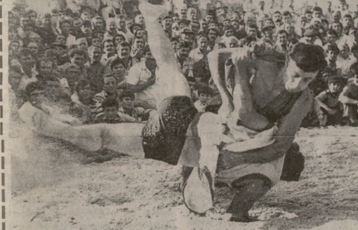
ქართული ჭიდაობის პროფესიული ფედარაციის პრეზიდენტი...