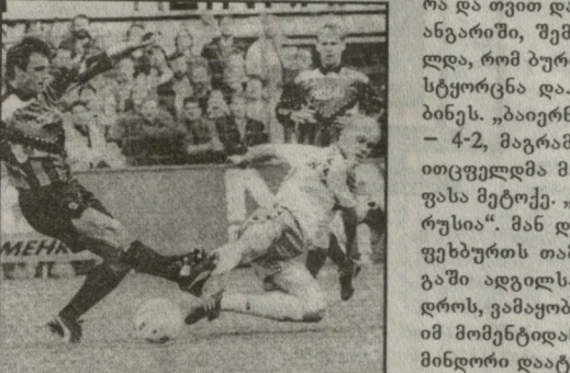
წვიოს, ვისი განთავისუფლება ითხოვოს. მართალია, აქ უკვე მწვრთნელის ნებართვაა საჭირო: მწვრთნელი ოტ-მარ პიტცფელდცი „ბაიერნი“ მეტად „გაგულისებულ“ მივიდა. მას არ შეეძლო ეპარტიებინა დორტმუნდის „ბორუსიისათვის“, რომ მთელ 1997-98 წლებს სეზონის განმავლობაში მწვრთნელის თანამდებობა დაატოვებინეს, ტექნიკურ დირექტორად გადაიყვანეს, მისი ადგილი კი იტალიელ ნევიო სკალას დაუთმეს, რომელმაც საერთოდ ვერაფერს მიაღწია. აი, რაც „ბორუსიაში“ არ დააცადეს, პიტცფელდმა „ბაიერნი“ გააკეთა და კლუბს სრულიად დამსახურებულად მოუპოვა ჩემპიონობა. ეს იმის მიუხედავად მოხდა, რომ მიუნხენელებს კარგა ხნით გამოაკლდა მთავარი სწავლებელი ელბერი, ბევრი მატჩი გამოტოვა შესანიშნავმა მარჯვენა მცველმა, მსოფლიო ჩემპიონმა ლიზარაზიმ, მაგრამ „ბაიერს“ ხომ საკმაოდ „გრძობელი სკამი“ აქვს...

თუ შემადგენლობის მიხედვით ვიმსჯელებთ, „ბაიერს“ ამ მხრივ ჩემპიონატში არაფერი უნდა გასჭირვებოდა. იგი ხომ ბუნდესლიგაში ფაქტობრივად ერთადერთი გუნდია, სადაც თითოეული ადგილისათვის უმძაფრესი კონკურენციაა შექმნილი. ეს მენეჯერული პოინტის დამსახურებად მიაჩნიათ, რომელმაც მშვენივრად იცის, რომელი ახალი მოთამაშე უნდა მოი-