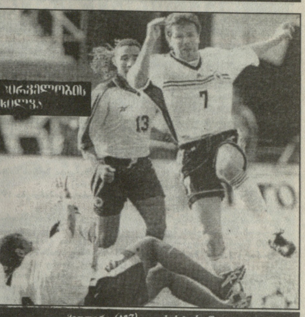
ბიოლოგი (№7) თავის სტიქიაში...

ვრესი პრეტენდენტები იყვნენ, ახლა კი „ბორუსია“ სულ უკანასკნელ, მე-18 ადგილზეა და კარგა ხანია აღარაფერი შეეღიოს. ამის მიუხედავად, მისმა თავდამსხმელებმა იორგენ პეტერსონმა (შვეიცია) და ტონი პოლსტერმა (ავსტრია) მიუნხენელთა განთქმულ დაცვას არაერთი პრობლემა შეუქმნეს. ოლივერ კანმა ჯერ პოლსტერი წააქცია, რისთვისაც პენალტი დაიმსახურა და თვით დაზარალებულმა გახსნა ანგარიში, შემდეგ კი ისე განეგრძო, რომ ბურთი ტრიბუნებისაკენ გასტყორცნა და... მინდორიც დაატოვებინა. „ბაიერნი“ ბოლოს გამარჯვება 4-2, მაგრამ მისმა მწვრთნელმა პიტცფელდმა მანც ღირსეულად შეაფასა მეტოქე. „ძალიან მეცოდება „ბორუსია“. მან დღეს უჩვენა, რომ კარგ ფეხბურთს თამაშობს და ბუნდესლიგაში ადგილსაც იმსახურებს. ამავე დროს, ვამაყობ ჩემი ფეხბურთელებით იმ მომენტებთან, როცა ოლივერ კანს მინდორი დაატოვებინეს, ვეველა შესანიშნავად თამაშობდა“. ძალიან კარგად ჩაატარა ლიდერმა XXX ტურის შეხვედრა სტუმრად „შტუტგარტთან“ - 2-0, სადაც მექმეტე შოლმა და კარსტენ იანკერმა თავი გამოიჩინეს.