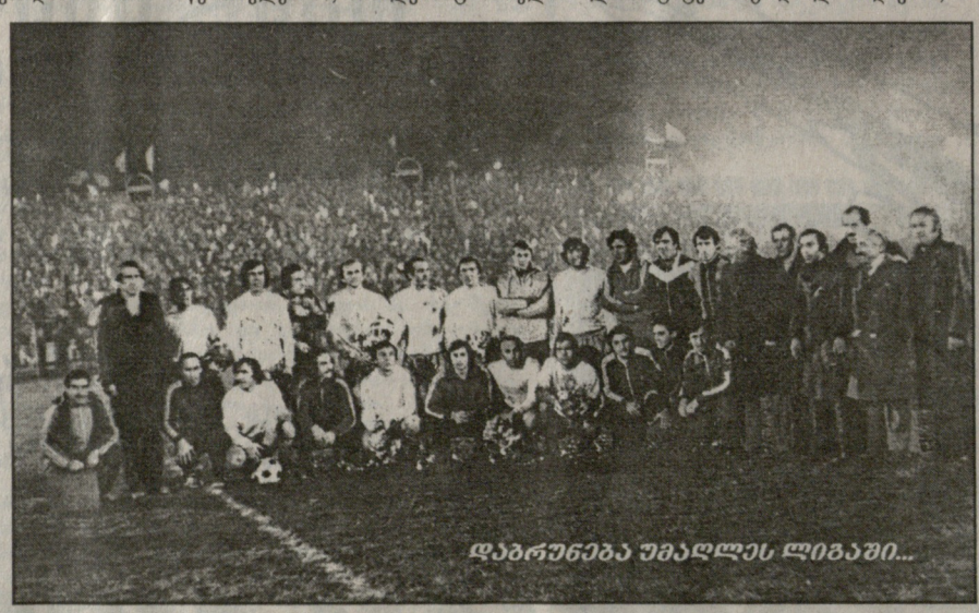
დაბრუნება უმაღლეს ლიგაში...