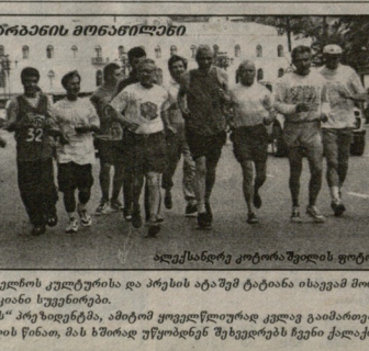
დასწრებას კორნაძის ფორტის მფლობელი...