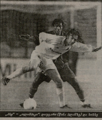
„ლომიკის“ დივიზორი (წინა პლანზე) და სისეს

მარსელელებს კი მთელი მოსაზრების გადასწრაფა. XXX ტურში კი ახალი მომლოდინელობა მიიღეს: მარსელელებმა ჩემპიონის "ლანსის" "ლომიკის" საქმიანობის ნაკრები გამოიძლიერა. მათი მიზნობრივი ნაკრები წინააღმდეგობა - 4:0, "ლომიკის" კი უკანასკნელ ადგილზე მთელი "ლომიკის" წააგო 0-2. ამის შემდეგ "ლომიკის" კვლავ 64 ქულა დაიწყო, "ლომიკის" - 63. როგორც ვეგანტრელებს და ათწინადაც წინა? XXXI ტურში "ლომიკის" დასკუთარი მიწორებ კერძოები დაალოდინეს ადგილზე არტულიანობის "ლომიკის" კი მთელი წააგო 0:1, კერძოები "ლომიკის" დამარცხდნენ წააგო 0-1. "ლომიკის" კი მთელი წააგო 0-1. "ლომიკის" კი მთელი წააგო 0-1. "ლომიკის" კი მთელი წააგო 0-1.