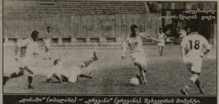
„ლინამო“ (თბილისი) - „ერევანი“ (ერევანი). შეხვედრის მომენტი.