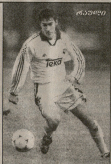
სიმბოლო: 1 მეტრი და 80 სმ. წარება: 68 კგ. კარიერა: თამაშობს მადრიდის „რეალში“ 1992 წლიდან დღემდე. მატჩების რაოდენობა პირველ დივიზიონში — 193. გოლი: 84. წოდებები: ჩემპიონთა ლიგის 1997-98 წლების გათამაშებაში გამარჯვებული, საკონტინენტთაშორისო თასის 1998 წლის მფლობელი, ესპანეთის ორგზის ჩემპიონი, ესპანეთის სუპერთასის მფლობელი.

— რაიმე კონკრეტული წინადადება არ მიმიღია. მე კი არსად მიწავსვლა. „ლოკომოტივი“ კარგ კლუბს სად ვნახავ.