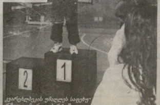
საინჟინერო საბუნებისმეტყველო სასწავლებელი