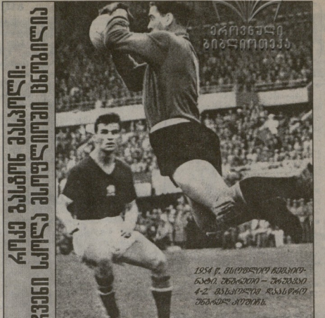
ჩვენი 2000. შემსრულებელი კრებული 2-1 ლიბანი (34), 20 სოლიდარი (55) 2-1 კარბიანი (62)