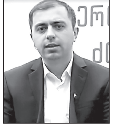
„პრემია რომ ვერ მოიმატეს, ბორჯომში სპეცრაზმი შეიყვანეს და ქართველი ერის ამოწყვეტა რომ მიდის, მაგისტვის 20 ლარი გაიმეტეს“

საკავშირის მმართველობის ბოლო წლებში. მაშინაც იყო რაღაც პერიოდი, როცა ალტერნატივა არ იყო. შევარდნაძის დროს, 1999-დან 2002 წლამდე პერიოდში იყო ასეთი ვაკუუმი და სააკაშვილის დროს 2010-2011 წლებში იყო ასეთი ვაკუუმი, როცა ხელისუფლება უდრდა ნულს და ოპოზიციაც უდრდა ნულს.