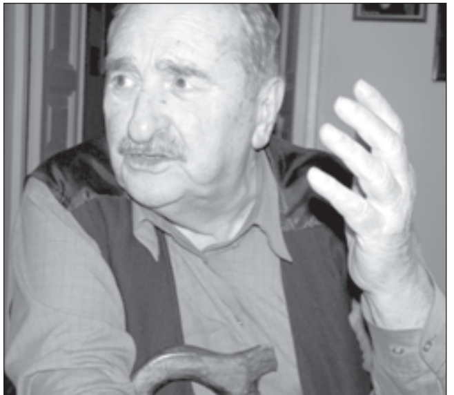
ლისუფლება და საქართველო ერთი და იგივეა ამ შემთხვევაში. აკრძალვამ დაიწყო მართლმადიდებელი ეკლესიის, ვერ გეტყვი, მაგრამ უკეთესი სხვა სახის ურთიერთობა იქნებოდა, უფრო დიპლომატიური. ხელისუფლება ამ პრობლემას მაინც ვერ მოაგვარებს, ეს პოლიტიკურ დონეზე გადასაწყვეტი საკითხია. რუსეთის აგენტობასა და