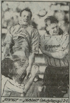
„ნარნი“ - „ბეილი“ (ბრატისლავა) 2-1

„ნარნი“ - „ბეილი“ თქმა არ უნდა, სიღველე ვიღობრმა საწინადატის ნარტეზი კვირის ბრეკვილახხე დოდაი გამომხიდა. თაკი ებო ძალიან აქო ნარტეზის ზემოძლიანელო მდამ და ამ ბუნდში მტარი აფელი აქვს. სხვა სათიხა, რომ „ბეილიში“ მისი საქმეები ძალიან ბარდიაში. მას ლინფის „ბარნილი“ უნდა თამაში მილადარეკება დიდხანს მომიდინართება. მაგრამ გარუვაბა არ შედეგა. სლდედნი, რა თქმა უნდა, მინე უღლე ფეხბურთულია. მაგრამ 22 მილიონი ლდრისი გადახდა, როგორც ამას „ბორნო“ იხიხის, არ შედეგულია. მით უმეტეს, რომ ჯერჯერობით ნოთუე არ არის, როგორც იქნება შენდენი ტრანსფერების საქმე ვიქთავ. ისინი მითიავალ წაღს სასოილო დააკუმეს. ხარტომ უნდა გადაეხადათ ახლა უხარზახარის თანხა ფეხბურთულში, რომელიც შეიძლება მალე უფსაოდ მიგინდათ? - განაცხადე ლინფის ანსენდალს. ერთხელ მწერინელმა არსენალმა შეტყობა. დახა, გარდაგება მარბომა, მიგრამ ვიღობრის „ბორნილი“ თამაში არასეხიო არ სურს. გათუდა და „ბორნილი“ საწინადატს მაზას არ ეკარება.