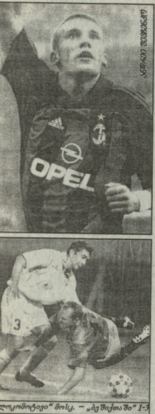
„ლიკორბიტი“ შილი - „ბეშილენი“ 1-3

„ნარნი“ - „ბეილი“ თქმა არ უნდა, სიღველე ვიღობრმა საწინადატის ნარტეზი კვირის ბრეკვილახხე დოდაი გამომხიდა. თაკი ებო ძალიან აქო ნარტეზის ზემოძლიანელო მდამ და ამ ბუნდში მტარი აფელი აქვს. სხვა სათიხა, რომ „ბეილიში“ მისი საქმეები ძალიან ბარდიაში. მას ლინფის „ბარნილი“ უნდა თამაში მილადარეკება დიდხანს მომიდინართება. მაგრამ გარუვაბა არ შედეგა. სლდედნი, რა თქმა უნდა, მინე უღლე ფეხბურთულია. მაგრამ 22 მილიონი ლდრისი გადახდა, როგორც ამას „ბორნო“ იხიხის, არ შედეგულია. მით უმეტეს, რომ ჯერჯერობით ნოთუე არ არის, როგორც იქნება შენდენი ტრანსფერების საქმე ვიქთავ. ისინი მითიავალ წაღს სასოილო დააკუმეს. ხარტომ უნდა გადაეხადათ ახლა უხარზახარის თანხა ფეხბურთულში, რომელიც შეიძლება მალე უფსაოდ მიგინდათ? - განაცხადე ლინფის ანსენდალს. ერთხელ მწერინელმა არსენალმა შეტყობა. დახა, გარდაგება მარბომა, მიგრამ ვიღობრის „ბორნილი“ თამაში არასეხიო არ სურს. გათუდა და „ბორნილი“ საწინადატს მაზას არ ეკარება.