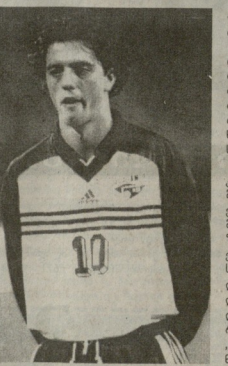
სადაც ვარ, ისე ვარ

ფუნქციონირება - თბილისში როგორ ვინც - სადაც ვარ, ისე ვარ - სადაც ვარ, ისე ვარ - სადაც ვარ, ისე ვარ