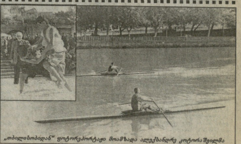
„თბილისობაზე“ ფოტორეპორტაჟი მოამზადა ავტორსანდრე კოტორას შეიქვია