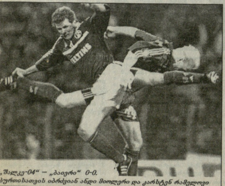
„შალკე-04“ - „ბაიერნი“ 0-0