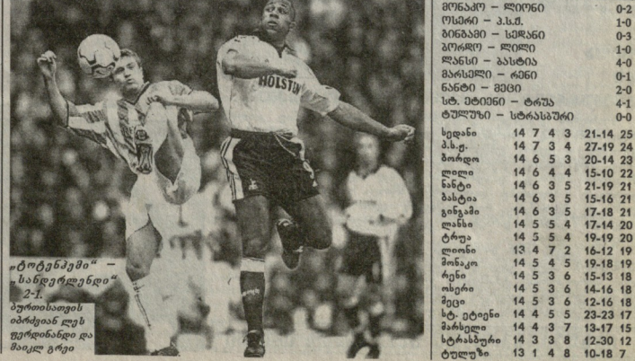
„ტორენტი“ - „სანტორენტი“ - 2:1. მურთალიის იტალიის ეპროპიის ჩემპიონი.