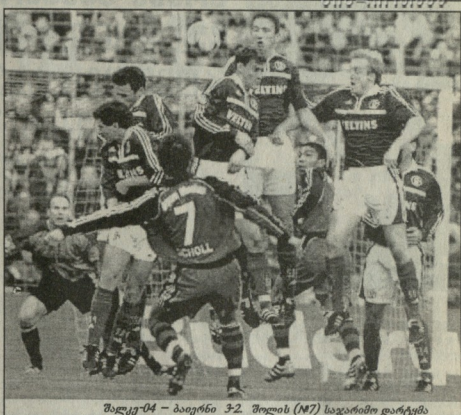
შავი-04 - ბავარი 3:2, შოლს (N7) სევერის დირექტი