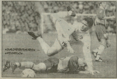
ბრაზელდორფი — ელიდსი

ლი — სავთჰემპტონი, ტორტენემი — ნიუკასლი. XXVII ტური, 10 თებერვალი. არსენალი — იფესბი, ასტონ ვილა — მილდსბრო, ჩარლტონი — ნიუკასლი, ჩელსი — მანჩესტერ ინიანტილი, ვერტრინი — ლესტერი, ლდსი — დერბი ქაუნტი, მანჩესტერ სიტი — ტორტენემი, სავთჰემპტონი — ბრედფორდი, სანდერლენდი — ლეფერპული, ვესტ ჰემი — კოვენტრი. XXVIII ტური, 24 თებერვალი. ბრედფორდი — ვესტ ჰემი, კოვენტრი — ჩარლტონი, დერბი ქაუნტი — ასტონ ვილა, იფესბი — ვერტრინი, ლესტერი — სანდერლენდი, ლეფერპული — ჩელსი, მანჩესტერ ინიანტილი — არსენალი, მილდსბრო — სავთჰემპტონი, ნიუკასლი — მანჩესტერ სიტი, ტორტენემი — ლდსი. XXIX ტური, 3 მარტი. არსენალი — ვესტ ჰემი, კოვენტრი — ჩელსი, დერბი ქაუნტი — ტორტენემი, ვერტრინი — ნიუკასლი, იფესბი — ბრედფორდი, ლდსი — მანჩესტერ ინიანტილი, ლესტერი — ლეფერპული, მანჩესტერ ინიანტილი — სავთჰემპტონი, მილდსბრო — ჩარლტონი, სანდერლენდი — ასტონ ვილა. XXX ტური, 17 მარტი. ასტონ ვილა — ვერტრინი, ბრედფორდი — მანჩესტერ სიტი, ჩარლტონი — ლდსი, ჩელსი — სანდერლენდი, ლეფერპული — დერბი ქაუნტი, მანჩესტერ ინიანტილი — ჩელსი, ნიუკასლი — მილდსბრო, სავთჰემპტონი — ვერტრინი, ტორტენემი — კოვენტრი, ვესტ ჰემი — იფესბი. XXXI ტური, 31 მარტი. არსენალი — ტორტენემი, ბრედფორდი — ნიუკასლი, ჩარლტონი — ლესტერი, ჩელსი —