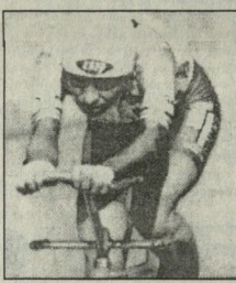
გამოყენება და გააუმჯობესა ამ სპორტულ მანქანაში ადრინდელი მიწვევები ჩამოყარა ლონგის სტრატეგიკული, რომელიც მან იყენებდა, მისთვის რომელიც ტრეკზე, აღმათ აფროლიან-მეტიკის კონსტრუქციის, დაახლოებით 1996 წელს...