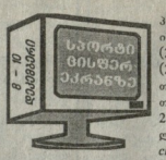
პიონის ლევა (6:00, 16:30), ინგლისის პრემიერლიგა (21:30), კალაბურთი: ნაბა (2:00, 2:30). EUROSPORT. თხილდაბურები. მსოფლიო თასი (12:30, 13:00, 13:30, 22:30), ტენისობა. მხო- ვლი თასი (0:00). HTB ნიუ-იორკი. მსოფლიო ჩემპიონატი (14:50), სოკრეთი. დევისის თასი (19:00) ხელბურთი. ვეროის ჩემ- პიონატი, ქალბები (22:55).

9 დეკემბერი, შაბათი საქარმენტი ქვეყანაში. მე-9 არხი. ვეროის სტადიონზე (20:00). HTB ნიუ-იორკი. ვერმანის (13:15, 18:25), შოტლანდიის (15:50), ბრაზილიის (17:35), ინგლისის (20:35), მინეაპოლისის. მსო- ფლიო ჩემპიონატი (22:25). „შაბათი და- დამოს“; იტალიის ან ესპანეთის ჩემპი- ონატი (23:25). „შაბათი დამოს“ გაგე- რებულება (1:35). ESPN. ფეხბურთი: ჩემ-