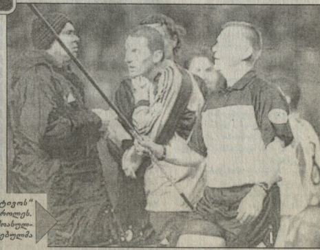
მილანელ შეკარე აბატის „ფეხბურთეობის“ გულშემატკვრეობა დროშის ტარიცრალის. თავის ტრავმირებული შეკარე წელით მისაღ- ვირებს... ამის შედეგ მს უფრო გახლებულმა თავაშა...