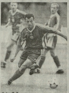
მეინე შა შუალი