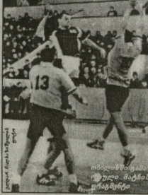
მოდანია - საქართველო 22:24 ფინეთი - ავსტრია 33:25

ხელბურთელთა საქართველოს ეროვნული ნაკრებმა ტიტულის კეცვანაში საპასუხო მატჩი გამართა მოხალდებულებთან და დამარცხდა 22:24. მარცხის მიუხედავად, გაუფიქრებელი გაცხადების მიხედვით შანსი რჩება თეორიული, ფანტაზია კი უკვე აღარაა.