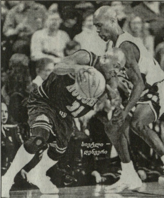
სიეტლი - დენვერი

კლოტერსი: შაილი (20), რიარდსონი (19). სიეტლი - დენვერი 104:77 სიეტლი: პეიჯონი (25+12 გადაცემა), ლიუსი (17), ბეიერი (15), მისონი (13) დენვერი : ვან მენი-ლი (28), ლუნარი (16). ვოლდენ სტიტონი - მინესოტა 102:105 ვოლდენ სტიტონი: ჩი-მოსონი (23), სურა (23), დამპ (23). მინესოტა : ვარნეტი (21), ბოლანი (21), შერიბაიკი (20).