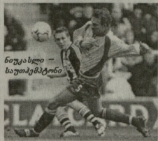
ნიუკასლი - საუთემპტი

ბელესი - ლას პალმასი 7-0 მიორენი (20, 35, 52, 71, 79), ხიდანი (33) ანგელი (70 სპ. კარნი)