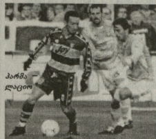
პარმა - ლაციო

ბოავიშტა 22 15 3 4 38-13 48 სპორტინგი 22 14 5 3 50-18 47