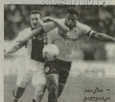
აიაქსი - ვალეჟი

აასტორი 22 4 3 15 18-51 15 ბევერნი 22 2 7 13 23-58 13