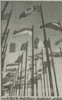
თამაშების მონაწილე ქართველების აღმშენებელი

ნაშვი, ცხელი, ცარიელი იყო. ჩაესხდით და ტრიალებდით. წინ კიდევ ექვსსაათი უნდა დარჩენოდა. ატორიტეტი ირავლი ჯაფარიძე, გერარდ ბარბაქაძე და სხვა ჩემპიონები გველოდნენ.