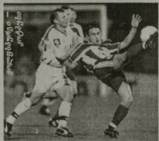
საუთემპტი - ვევერტონი