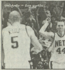
„ბოსტონი - ნიუ-ჯეისი“