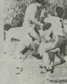
გურია-2 - სულერი 2-3 ჩიხურა - საპოვნელი (6:06)