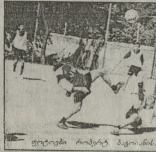
ფოტო რეპორტ მავიანისა

დირექტორი - ლ. ნინოშვილი - დაიწყო მათეისა განსაკუთრებით უკეთესად დაიწყო მათეისა და ბოლის, იმასე შედეგით, რომ ტურნირის გამარჯობდა სხვა რაოდენობით გამარჯობდა გუნდებთან ერთად მიმდებარე წლის სტრუქტურის მიხედვით ისპარხის სასკოლოებს პირველად.