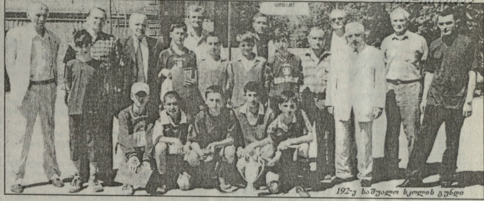
1922-ე საშუალო სკოლის გუნდი