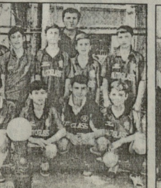
ფოტო რეპორტ მავიანისა