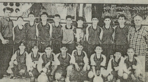
ფოტო რეპორტ მავიანისა