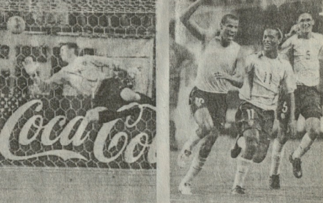
დაფიქსირა ჩაყოფილ გოლს ბრაზილიელმა ჩამდინებე სხანოსანო ტორედნე, თქმს ანგარმის გათი ნარმატე ვერე მომარტხეს, პირველი ბატის დამთავრებულდ სმი წიფით ადრე საკრთაშორისო გოლი მოხლს. თბილისი ჩინელიმ გამოიჩინა ბრაზილის ნაკრებმა გამოიჩინა 2-0 და გაიდა შეიხედინდნენ, სადაც მინაროესი ვოლტერი დაფიქსირდა.

ეამ წიფებ ვერეკლამა გოლი გაიტანეს. მარცხე მქვანამ საკრთაშორისო გუნდის გარეგანად, მარცხე მქვანამ რატონდ ცხადებო, რომ ბრაზილიელ ფეხბურთელებს წესს დარღვევა