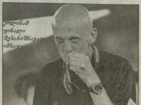
კოლინამ ფინალში შეტანილი იმსაჯა