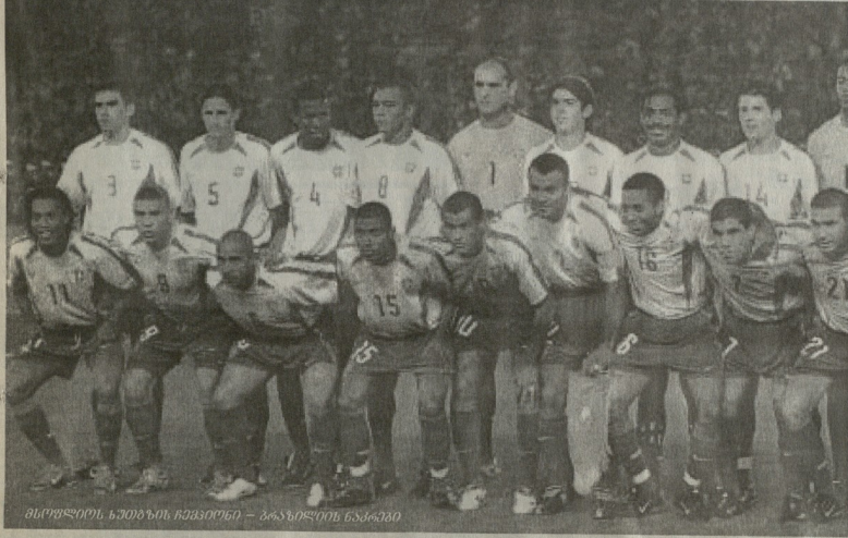
მსოფლიოს სათავის ჩეაპიონი — ბრაზილიის ნაკრები