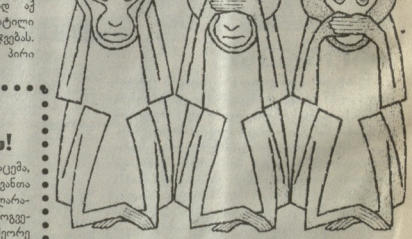
არაფერი მხსენია... არაფერი დამინახავს... ვერაფერს ვატივ...

მივიღებ დარბაზი მაინც აიგოს. და გრძელად კიდევ დაამტკიცდეს, რომ ხალხს უფროსი მესხიერება აქვს, როგორც ყოველთვის, ვიდრე ზედსიფთობა.