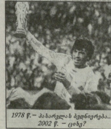
1978 წ. — პასარელი პრეპრეპრე... 2002 წ. — ციხე?

„ჩვენ მიუღვეთი სასამართლო პროცესი „აიხიერს“ (სხე ეტაპის დანიელ პასარელს) და ფაქტობრივი მთავარი მწვრთნელი ნაპოლეონ ანალიტის“ — განაცხადა ურსუბავის ფეხბურთის ფაქტობრივი უფროსი მთავარი მწვრთნელი უფროსი მთავარი მწვრთნელი.