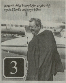
სურათი პრეზიდენტი ლენარტი თუბანიძის თბილისში