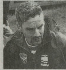
„წაიჭოდა ბურთი ბაჯოს, — ეს იტალია, ჩავი პრესისთვის ფურეი წაიჭოთა“ — წერს „ლა გაზეთი“ დილო სპორტი.

„საქმეზარი“ შედეგით დასრულდა იტალიური ფეხბურთის ვარსკვლავის ბაჯოს ერთ-ერთი პლუჯი, სადაც მან მოიხილა დამსვენებელითაგანის კენჭები. საკუთარი ტენიცი და ბურთით ენერჯია დაიწყო. მოდერნ პლუსი დაეცა თანამშრომლები და ბაჯოს ბურთი წარმოვეს, რადან ადგილობრივი წესები პლუჯი ბურთით თამაში არ შეიძლება. „წაიჭოდა ბურთი ბაჯოს, — ეს იტალია, ჩავი პრესისთვის ფურეი წაიჭოთა“ — წერს „ლა გაზეთი“ დილო სპორტი.