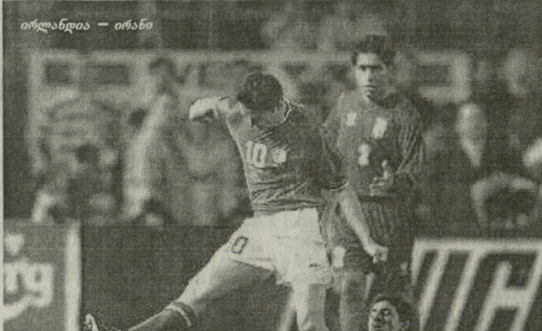
ირლანდია - ირანი

შემდეგ, რაც ოქანმა შანსი არ დაუტოვა ავსტრიელთა მეკარეს.