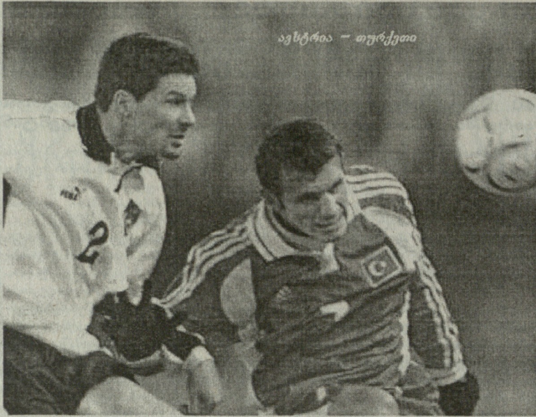
ავსტრია - თურქეთი

რუმინეთი: სტელია, კონტრა, მიუ (პანჩუ 90), იენჩი, ჩიუუ, პოპესკუ, საბუუ (გიოანე 84), მუნტიანუ, მუტუ, ნიკულაე, ა. ილიე (როზუ 84)