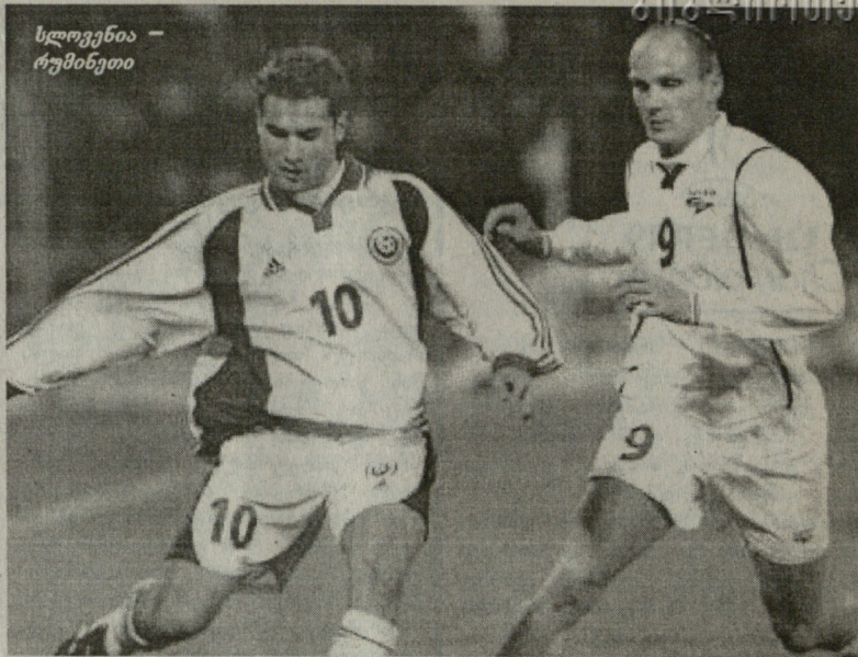
სლოვენია - რუმინეთი

გოლები: 0-1 ნიკულაე (26), 1-1 აიმიოვიჩი (42), 2-1 ოსტერცი (70).