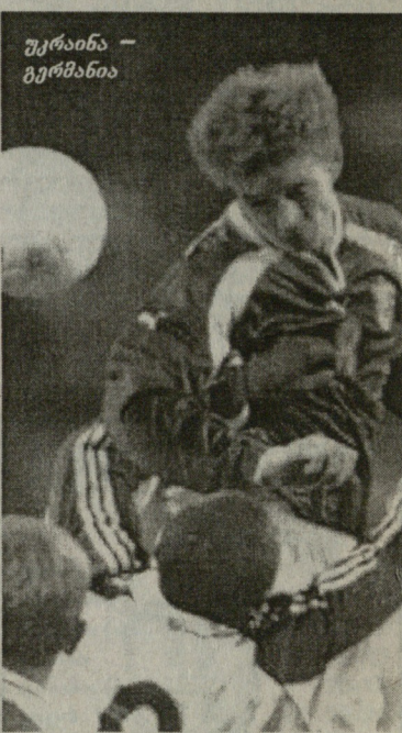
უკრაინა - გერმანია