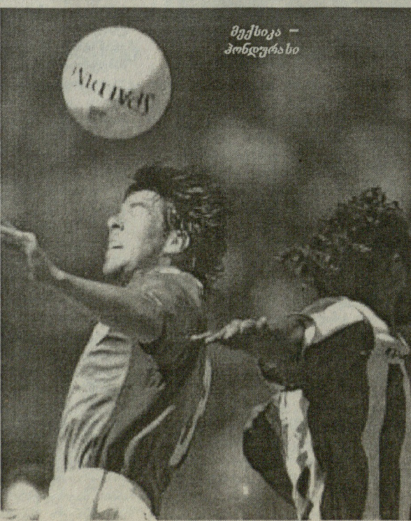
მექსიკა - ჰონდურასი

ამრიგად, მექსიკის ნაკრები გახდა რიგით 25-ე ქვეყანა, რომელმაც მოიპოვა 2002 წლის მსოფლიო ჩემპიონატის ფინალურ ეტაპზე თამაშის უფლება, მანამდე ეს უფლება მოიპოვეს: კორეა და იაპონია (როგორც მასპინძლები), საფრანგეთი (მსოფლიოს ჩემპიონი), კამერუნი, ნიგერია, ტუნისი, სენეგალი, სამ. აფრიკა (აფრიკის ზონიდან), კოსტა რიკა, აშშ (კონკაკაფის ზონიდან), ჩინეთი, საუ. არაბეთი (აზიის ზონიდან), არგენტინა, პარაგვაი, ეკვატორი (სამხრეთ ამერიკის ზონიდან), რუსეთი, პორტუგალია, დანია, შვედეთი, პოლონეთი, ნორვატია, ესპანეთი, იტალია, ინგლისი (ევროპის ზონიდან).