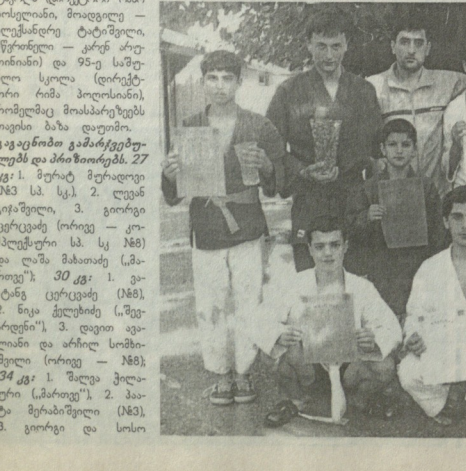
ფოტო რეპორტი ბავშვებისა