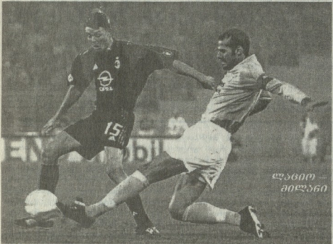
ლაზიო — ფიორენცინა

კაი კლასი „მილანს“ იტალიის სერია ა-ა მორატ ტურში მელ-სკალითი მატჩი ჰქონდა „ალავიოსთან“ — „მილანმა“ აყვარა გადამ-ლოლა ჩანდა, თუმცა პირველი ტა-რის შემდეგ 1-0 იკლებინ. მატჩის მიერა ნახევარი „ალავიო“ ბიტილი გუნდით შეუბრია და უდავლოდ ლო-პემმა ანგარიში გააანაზნა 1-1.