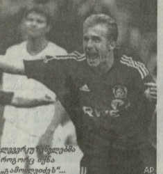
პორტო — ბრაგა

საგა მატჩები: ალგარვი — გარნი-ნგენი 4-1, ტრლუ-