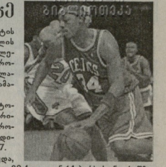
სსპ მატჩი: ბოლო კლასის კლუბები 90:100, ფერა - გოლდენ სტიტი 101:92...