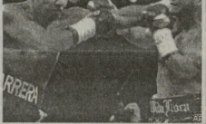
დასავლეთში ჩატარებული სასაქონლო მატჩი საქართველოს წინაპრების მიმართ...