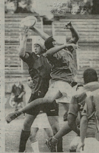
საქართველოს და სავსე-გუნდის მორაგბეთა ახალგაზრდა ნაკრებმა თბილისის ბირის პაქის სახელობის გრავი-ღვინის ტესტმატის შემდეგ სამსოფლიო ფიქრ გადაიღვა

შეკლავ გამოიღვენ: ფილიპი, დიორი, მალიანი, დიდიანი, სანდრა, კლარი, ბევი, ლარეა.