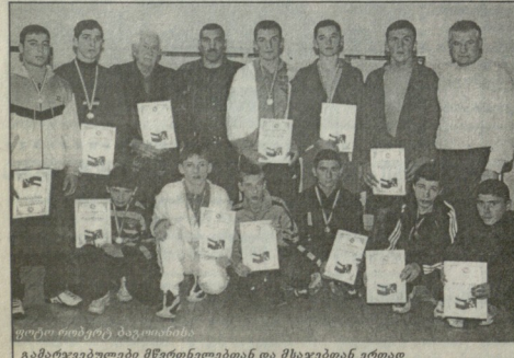
გამორჩეული მწერნიშნებიდან და მსაჯებთან ერთად

საქართველოს ქაჯაქი საქმისგანი ფინალური შეჯიბრება გაისაზრა მასში გამართვამ და საბოლოოდ დაამტკიცებდა საქართველოს ნაჯიბი, რომელიც მოსკოვში ქაჯაქი მსოფლიო თამაშების ისარჩევებს.