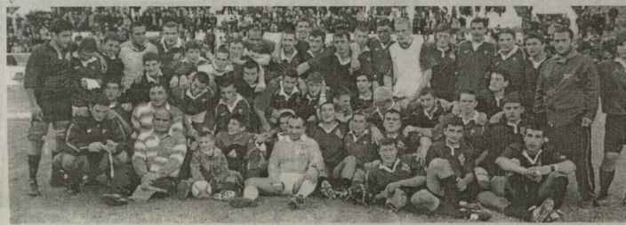
საქართველოს და სავსე-გუნდის მორაგბეთა ახალგაზრდა ნაკრებმა თბილისის ბირის პაქის სახელობის გრავი-ღვინის ტესტმატის შემდეგ სამსოფლიო ფიქრ გადაიღვა