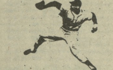
სსრ კავშირის ჩემპიონის ანატოლი პეკალი

ხელი ოლიმპიური სტადიუმის დაბრუნების მოთხოვნის. ამ მოთხოვნის განხილვა ჩვენს პრესაში და იგი დატოვებულია. მონაწილეობის უფლებები, სასწავლებლები. ბატონო აქტი ვიტყვი: მარცხნიდან, 19 იანვარს, რადგან შედეგად მართალი ორგანიზაციებისა და ფიზიკური კულტურის, რომელიც განხილულია უკლებიანი ოლიმპიური კომიტეტის (აიპი) ადგილის საკითხი. ოლიმპიური კომიტეტის (აიპი) ადგილის საკითხი. ოლიმპიური კომიტეტის (აიპი) ადგილის საკითხი. ოლიმპიური კომიტეტის (აიპი) ადგილის საკითხი.