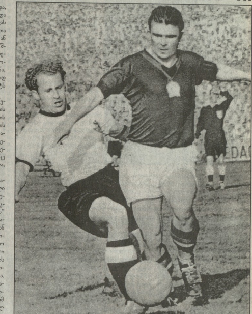
1954 წ. სსრკის ნაკრები. ფერენც პუშკაშვილი - გურ. ფეხბურთის მატჩის ერთ-ერთი მონაწილე. ფეხბურთის დიდების პუშკაშვილი (შავ მისურში) და გერმანელი მცველის დობის თიაბარძელი ბურთისათვის.