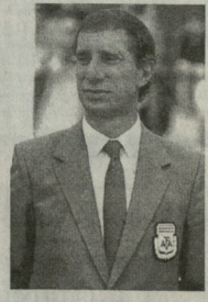
ფრეცის როგორც პრეზიდენტი

ბილარდის სიყვარულზე ფეხბურთისსადმი ლევენიბე დავის, ყოფიდა ასეთი შემთხვევაც ეთხელ შეუძლებ საშასხურში მიმავალ ბილარდისათვის პუროის ყიდვა დაზარაობა. ეს უქანასუნელი შინ მხოლოდ მეორე დილი დარბუნდა. თრემე უნიობი გამგებლებმა ქუჩაში აჩრეტდნენ ბილარდის და ფეხბურთზე ესაუბრებოდნენ. ამის გამო სპეციალიზირდის ხანს მერედიბოდა, საკუთარ სახლამდე მანდისი ვაკელს... 24 საათი მოუწია.