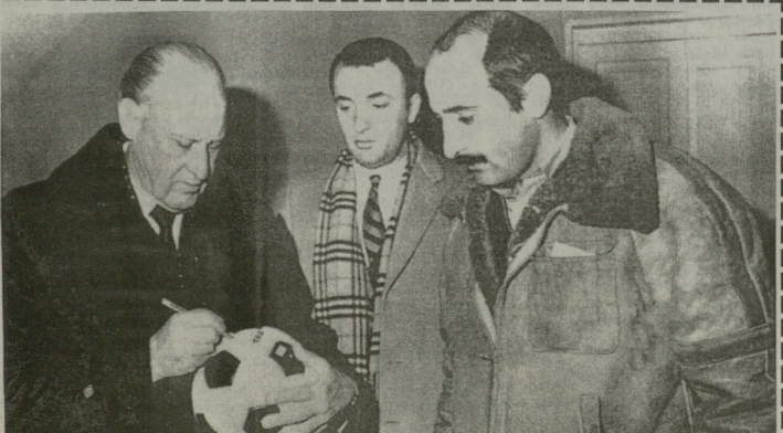
1985 წელს, ფიფას პრეზიდენტის ვიზიტი საქართველოს სპორტის განვითარების შესახებ საუბარის შემდეგ. ფოთის ფეხბურთის განვითარების შესახებ საუბარის შემდეგ.

არაფრად ახლოვდება. მოუღებ, არაა არ-აინარი პორტების, მანადგურა — არც ფიფასსებრი, არც მორალური. თუ ქალაქის მთელი ბაზრის განთავსება ამ პრინციპით დაინტერესდება, დაწესებულები ბრანდინგების წინააღმდეგობა. ქალაქის მთელი ბაზრის განთავსება ამ პრინციპით დაინტერესდება, დაწესებულები ბრანდინგების წინააღმდეგობა. ქალაქის მთელი ბაზრის განთავსება ამ პრინციპით დაინტერესდება, დაწესებულები ბრანდინგების წინააღმდეგობა.