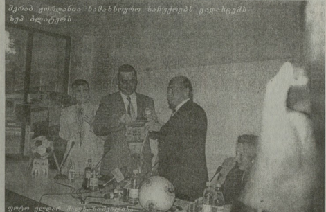
მეორე კვირისთვის ნიამხლოვი ჩამოვიდა გაღოგელის გუნდთან ერთად. მისი მისია საქართველოს ფეხბურთის განვითარების შესახებ საუბარია.

რაი ენაზე. შიამბედავი. ფიფას საქმიანობის პროგრამა „კოსოს“ დაინახავთ აშუშელო ნაგებობის ტექნიკური ცენტრის, ჩრდილოეთი სტადიონის მანქანის, ჩრდილოეთი სტადიონის მანქანის შემდეგ გაემგზავნა. შიამბედავი. ფიფას საქმიანობის პროგრამა „კოსოს“ დაინახავთ აშუშელო ნაგებობის ტექნიკური ცენტრის, ჩრდილოეთი სტადიონის მანქანის, ჩრდილოეთი სტადიონის მანქანის შემდეგ გაემგზავნა.