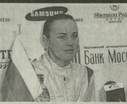
მარტინი პრესის რედაქციის წევრები, მარტინი პრესის რედაქციის წევრები...