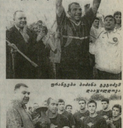
ფრანკები მისინა გვამამ დაჯადლორავი

შთაქრავი ჯიდიო თბილისის მესამე ენო ზიდედაკამ გადაცეს „მორჯადლონებს“