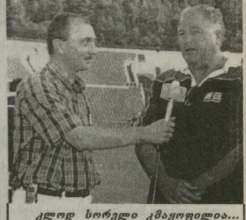
კლოდ სორელი კემეფიციედი...

შთაქრავი ჯიდიო თბილისის მესამე ენო ზიდედაკამ გადაცეს „მორჯადლონებს“