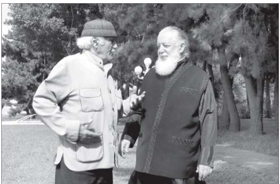
კათოლიკოს-პატრიარქი ილია მეორე და ოტინა იოსელიანი

ეროვნული ცნობიერების ჩამოყალიბებისთვის მშობლიური ენის მნიშვნელობის გადაჭარბებით შეფასება თითქმის შეუძლებელია. ამის შესახებ ბევრი თქმულა და დაწერილა როგორც ჩვენი, ასევე — უცხოეთში, მაგრამ გამოსაკვლევი და მისაგნები კვლავაც ბევრია. შორს რომ არ წავიდეთ, მარტო ილიას, აბაშიას, ვაჟას, იაკობისა და სხვა ცნობილ ქართველ მწერალთა და საზოგადო მოღვაწეთა გამოხატულებების გახსენება რად ღირს! მშობლიური ენის, როგორც ფენომენის, ამა თუ იმ კუთხით დახასიათებისას ჩვენი წინაპრები მას მოიხსენიებენ როგორც: „ღმერთების ენა“, „ღმერთების ენა“, „ღმერთების ენა“, „ღმერთების ენა“... „ერის მეობას, პირველ ყოვლისა, ენა არკვევს და შემდეგ — ხალხური სიმღერა, ხალხის განცდათა მესაიდუმლო,“ — ნერდა აკადემიკოსი არნოლდ ჩიქობავა დიდი ილიასადმი მიძღვნილ ერთ თავის წერილში (1978 წ.).