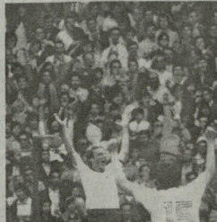
კარლ ჰაინც რუშენი

მართალია, თუ ვინც იტყვით, რომ რუშენი მსოფლიო ფეხბურთის განვითარების მიზნით მუშაობს, ეს არ არის სწორი. რუშენი მსოფლიო ფეხბურთის განვითარების მიზნით მუშაობს. მისი მიზანმიმართული მუშაობის შედეგად, მსოფლიო ფეხბურთის განვითარების მიზნით მუშაობს.