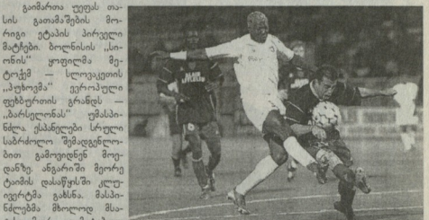
საფეხბურთო კლუბის მწვერვალზე მარჯვნივ - „იოჰანესბურგიდან“ მოსპოვების მიზნით დაწავალა.

გარი და კლუბის ხელმძღვანელებს სავაჭრო ენას განმარტებენ. ეს კარიერის საფუძვლი უილიამსმა „იოჰანესბურგიდან“ მოსპოვების მიზნით დაწავალა.