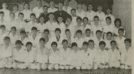
სრუბროვი და ვარგაბიანი