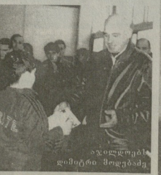
ავღორციელდა დიმიტრი მიგვიძის