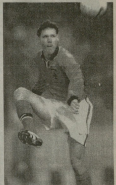
ესე ბელოლი „იაპატი“ პირველ გუნდში მოხვდებოდა 17 წლის ასაკში 1982 წელს.

პოლანდის სასტუმრო პოპარტო-რა: 1984, 1985, 1986, 1987 წწ. ფრანგული სასტუმრო სასტუმრო-კლუბი მოთამაშე 1992 წელს. 177 მატჩი „იაპატი“ შემადგენლობაში — 151 გოლი, 147 მატჩი „იპსილი“ — 90 გოლი, პოლანდის ნაკრები 58 მატჩი — 24 გოლი. სამწვერვლო კარიერა: ანსტრალიაში „იაპატი“ 2002 წლიდან.