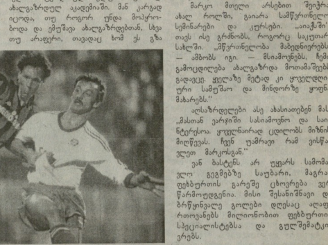
ესე ბელოლი „იაპატი“ პირველ გუნდში მოხვდებოდა 17 წლის ასაკში 1982 წელს.

პასუხი: 1. დიდი სტრუქტურის საპორტო აკადემიის წარმომადგენელია 1955 წლის იანვარში შეიქმნა და ნარჩის რაიონის ტურნე ჩაატარა იბერიაში, სადაც მან ველოლი შეიქმნა — 15 გაიტანა.