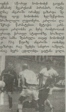
გორაკის ფეხბურთელები და მწვანე გუნდის ფეხბურთელები. გორაკის ფეხბურთელები და მწვანე გუნდის ფეხბურთელები.