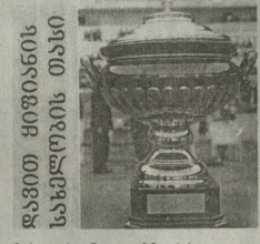
ნახევარტონიანი 20 აპრილი. დრესი, 16 საათი ტრადიციული (ქეთისი) - სპარტაკი (თბილისი).

„ლოკომოტივი“ და „ვიტ ჯორჯია“ დაიკარგნენ ერთმანეთს. „ლოკომოტივი“ და „ვიტ ჯორჯია“ დაიკარგნენ ერთმანეთს.