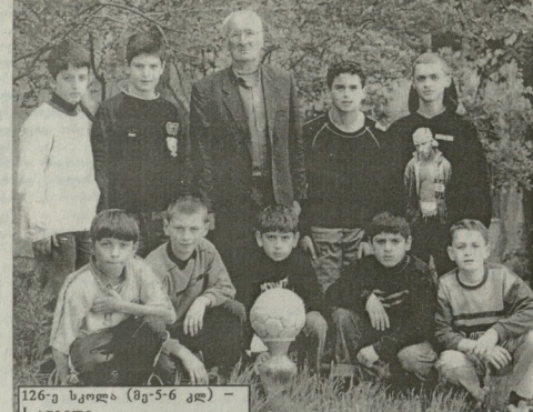
126-ე სკოლა (მე-5-6 კლ) - I ადგილი.

LELOSPORT.GE თბილისი სასპორტო, ლელოპორტის B.A.S (პეკრეკაპურიის სასპორტო) მისთვის ხანძარი მომზადდა სახანძროს მისთვის. მისთვის მომზადდა სახანძროს მისთვის.