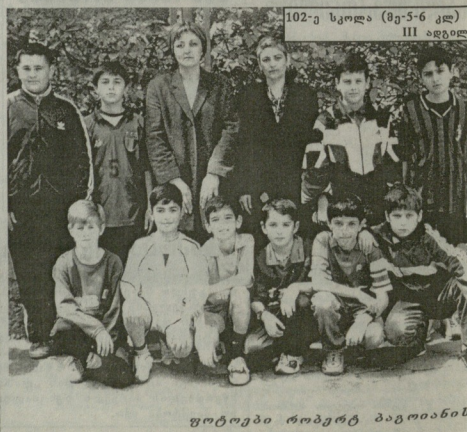
102-ე სკოლა (მე-5-6 კლ) - III ადგილი.