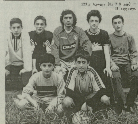
123-ე სკოლა (მე-7-8 კლ) - II ადგილი.