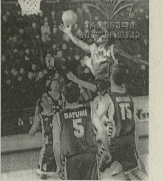
საქართველოს ეროვნული ოლიმპიკური კომიტეტი დაბადებიდან 65 წლისთვის...