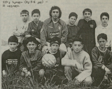
123-ე სკოლა (მე-5-6 კლ) - II ადგილი.