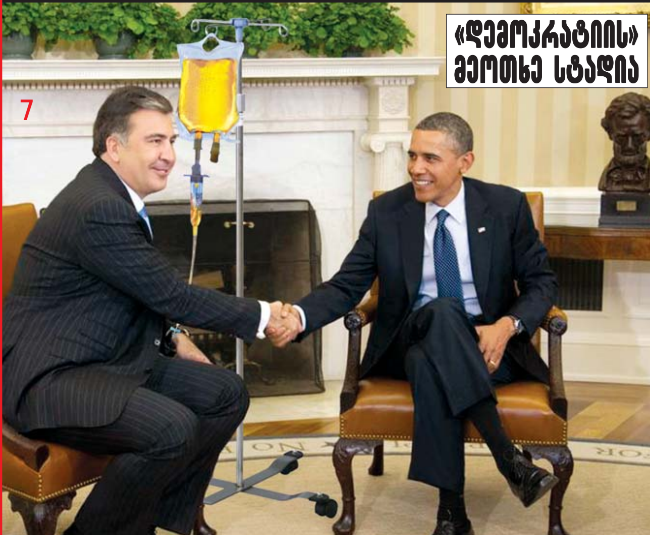
«დემოკრატიის» გეოტეხ სტანია